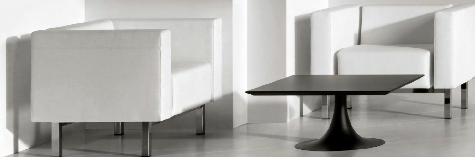
Modulo /1 seat ML0001